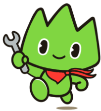
マスコットキャラクター さんぎたん