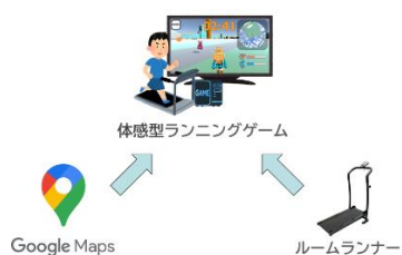
体感型ランニングゲームの概要

「どこでもランナー」は，Google Maps の地形データとルームランナーを活用したネットワーク対戦可能な体感型ランニングゲームです。利用者が，コロナ禍による運動不足やストレスを楽しく解消することを目的に開発しました。このシステムは，リモート環境で遠隔地にいる人を含めて最大4人まで一緒に利用することが可能です。利用者であるランナーは，コースを縦横無尽にランニングする人型キャラクタ「Unityちゃん」をコントローラとルームランナーの2つで操作します。このコースは，世界各地の主要都市から6か所を選定し，最新のGoogleマップデータベースから地理的対象物（建物，道路，海，川など）を取得して，Unity GameObjectとしてレンダリングします。コースでは，利用者が飽きないようにゲームを盛り上げる様々なイベントが随所で発生します。また，ランニングした日時，走行距離，消費カロリーの記録は，サーバに保存されており，利用者は，記録をいつでも閲覧可能です。このシステムは，令和2年度の卒業研究課題としてチーム名「GC」のメンバー4名と開発したものです。（「Unityちゃん」は，Unity Technologies Japanが提供する開発者のためのオリジナルキャラクターです。© Unity Technologies Japan/UC）