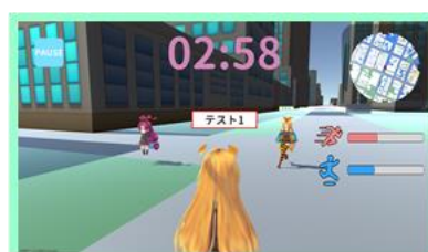
ネットワーク対戦中