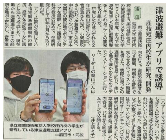
2022年3月13日山形新聞記事