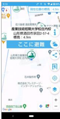
避難場所への誘導

酒田市の津波ハザードマップとオープンデータを活用し, 市内の避難場所を見える化, 地震発生時に避難場所へナビゲーションするスマホアプリを開発しました。