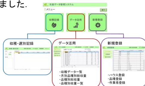
生産データ管理システム

多品種少量生産をしている農産物の品種毎の収穫量や選別・出荷データを蓄積し, 生産計画に活用するシステムを開発しました。また, 蓄積されたデータをもとにして, 機械学習・AI を活用し気象情報から生産量予測を行いました。