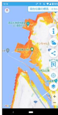
津波浸水想定区域の表示