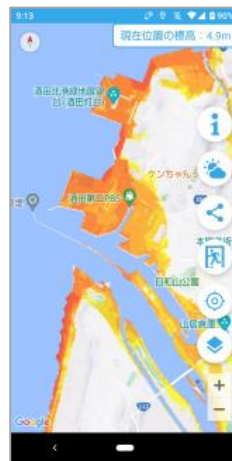
津波浸水想定区域の表示