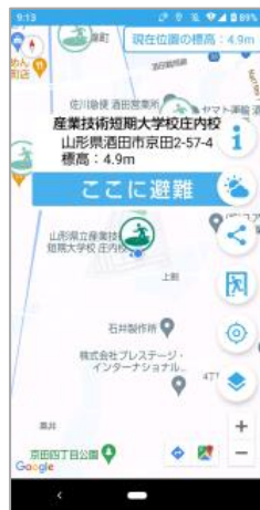
避難場所への誘導

酒田市の津波ハザードマップとオープンデータを活用し, 市内の避難場所を見える化, 地震発生時に避難場所へナビゲーションするスマホアプリを開発しました。